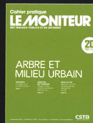
Arbre et milieu urbain Le Moniteur n° 5677 du 14/09/2012

(1) À retrouver pour les abonnés au Moniteur premium à l'adresse suivante... www.lemoniteur.fr/lemoniteur_numerique Commandez ce numéro du Moniteur au 01 40 13 50 65 abonnement@groupemoniteur.fr