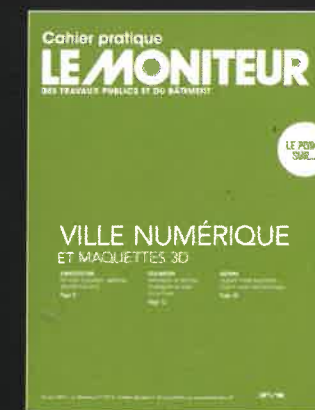
Ville numérique et maquettes 3D Le Moniteur n° 5711 du 10/05/2013