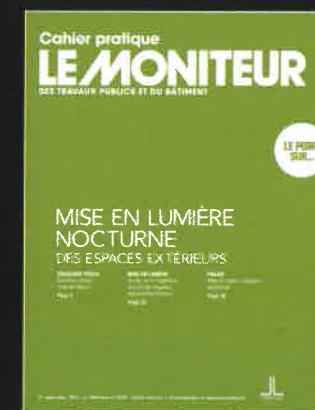
Mise en lumière nocturne des espaces extérieurs Le Moniteur n° 5678 du 21/09/2012