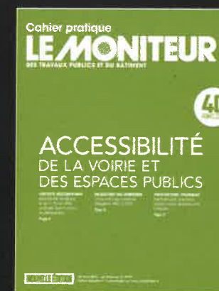
Accessibilité de la voirie et des espaces publics - Nouvelle édition Le Moniteur n° 5704 du 22/03/2013